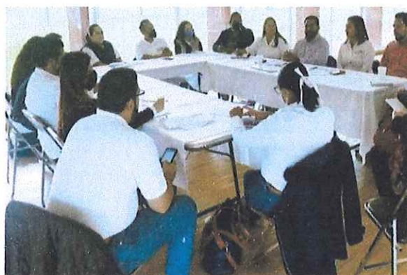
Reunión de trabajo 4 de octubre de 2022